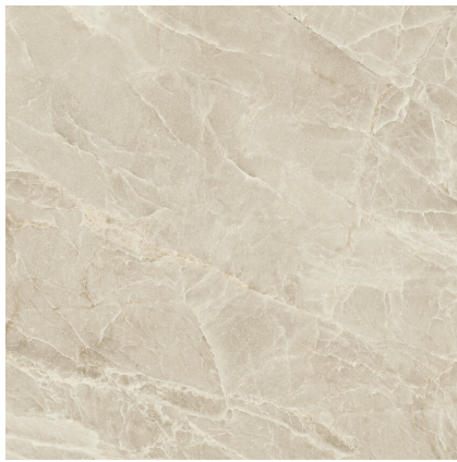
MAJESTIC CREAM SILKY P1212LB