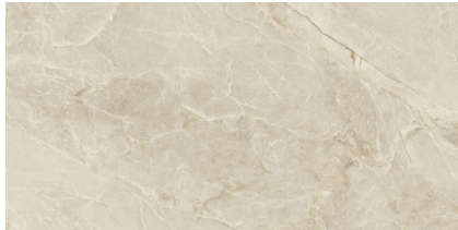
MAJESTIC CREAM SILKY P6012LB