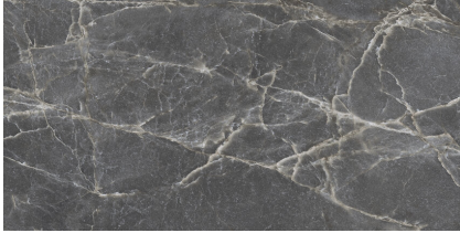
MAJESTIC DARK SILKY P6012R