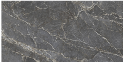
MAJESTIC DARK SILKY P8016R