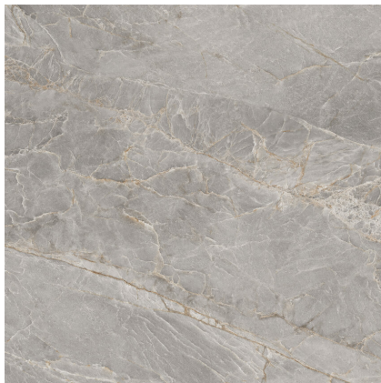
MAJESTIC GREY SILKY P1212LB