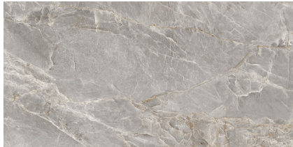
MAJESTIC GREY SILKY P8016LB