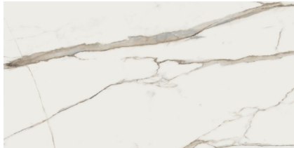
MARMARA GOLD NATURAL P6012L