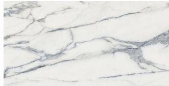
MARMARA BLUE NATURAL P6012L