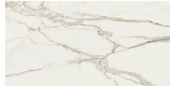
MARMARA GOLD PULIDO P6012P