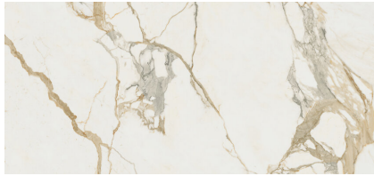
MEDICI GOLD NATURAL XL2612L