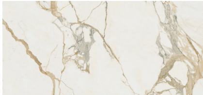
MEDICI GOLD NATURAL XL2612L