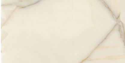
NEWBURY NATURAL P6012L