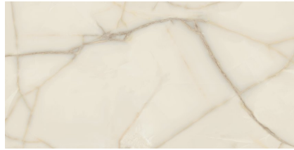
NEWBURY PULIDO XL2412P