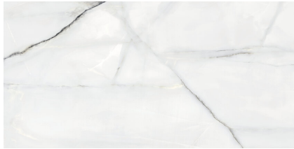
NEWBURY WHITE PULIDO XL2412V