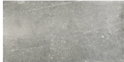
NICKON CHROME P6012L