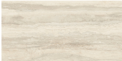
PALATINUM BEIGE P6012L