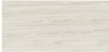
PALATINUM BONE XL2612L