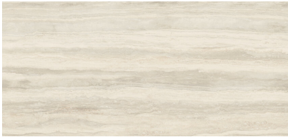
PALATINUM BEIGE XL2612L