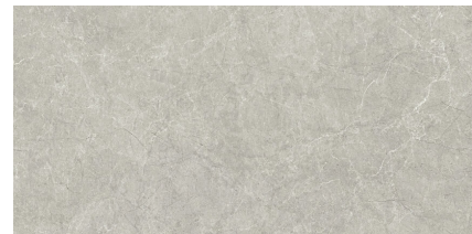
PIATRA GREY P8016L