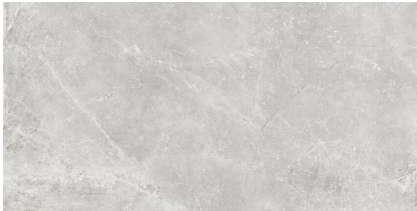
PIETRA ANTICA CENERA P8016LB