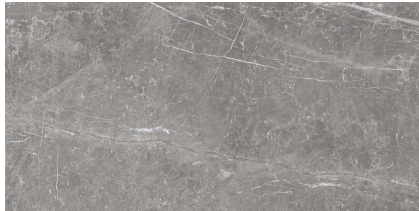
PIETRA ANTICA GRIGIO P6012LB