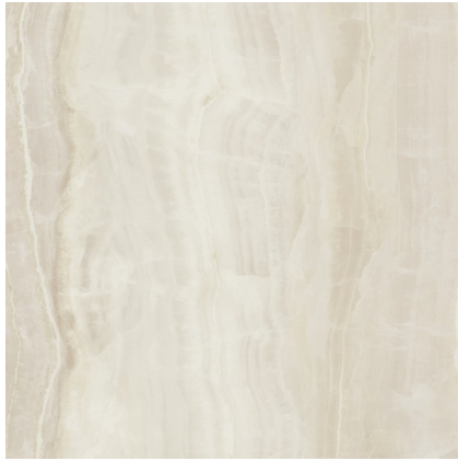
QUEEN IVORY PULIDO P1212P