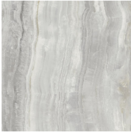
QUEEN PEARL PULIDO P1212P