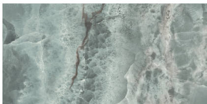
SAPHIRE JADE PULIDO P6012GRP