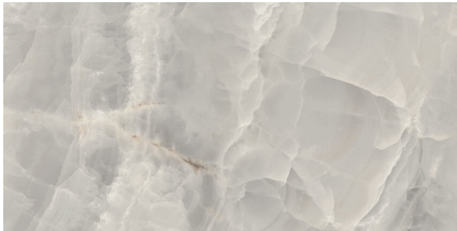
SAPHIRE NACRE PULIDO P6012GRP