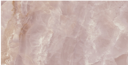
SAPHIRE ROSE PULIDO P6012GRP