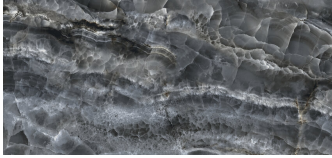
SAPHIRE NUIT PULIDO XL2612GRP