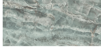
SAPHIRE JADE PULIDO XL2612GRP