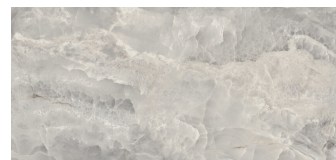
SAPHIRE NACRE PULIDO XL2612GRP