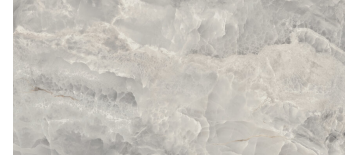
SAPHIRE NACRE PULIDO XL2612GRP