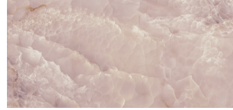
SAPHIRE ROSE PULIDO XL2612GRP