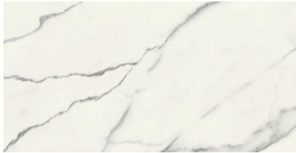
SIENA WHITE NATURAL PS6012LB