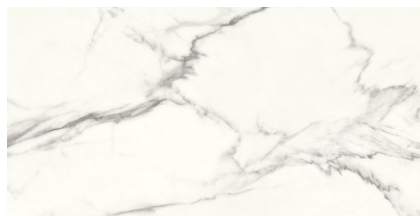
SIENA WHITE PULIDO PS6012P