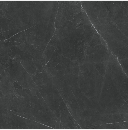
TESSINO BLACK NATURAL P1212E