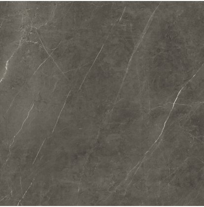
TESSINO BRONZE NATURAL P1212E