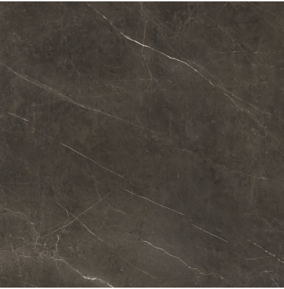
TESSINO BRONZE PULIDO P1212GRP