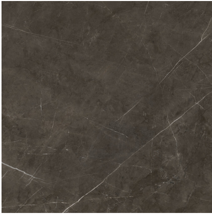
TESSINO BRONZE PULIDO PR8080GRP