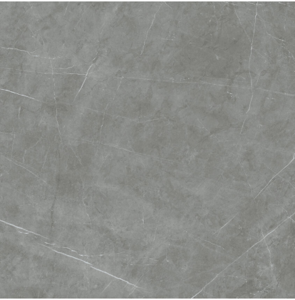
TESSINO GREY NATURAL P1212R