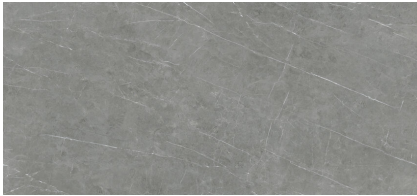
TESSINO GREY NATURAL XL2612R