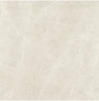
TESSINO IVORY NATURAL P1212L