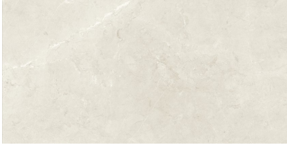
TESSINO IVORY NATURAL P6012L