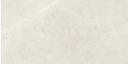
TESSINO IVORY NATURAL P6012L