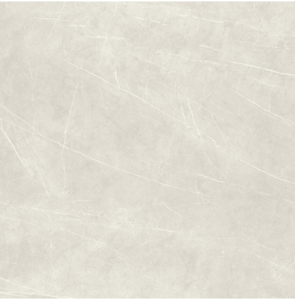
TESSINO IVORY PULIDO P1212P