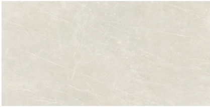
TESSINO IVORY PULIDO P8016P