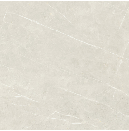
TESSINO IVORY PULIDO PR8080P