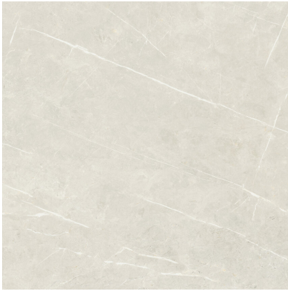
TESSINO IVORY PULIDO PR8080P