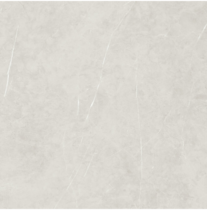
TESSINO SMOKE NATURAL P1212L