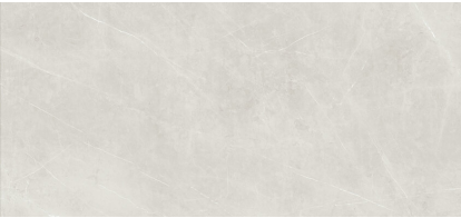
TESSINO SMOKE NATURAL XL2612L