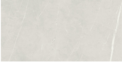
TESSINO SMOKE NATURAL P6012L