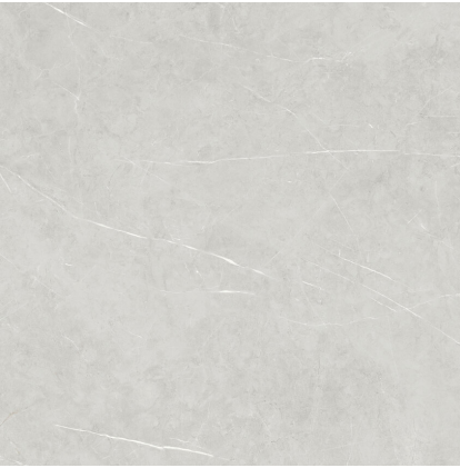
TESSINO SMOKE PULIDO P1212P