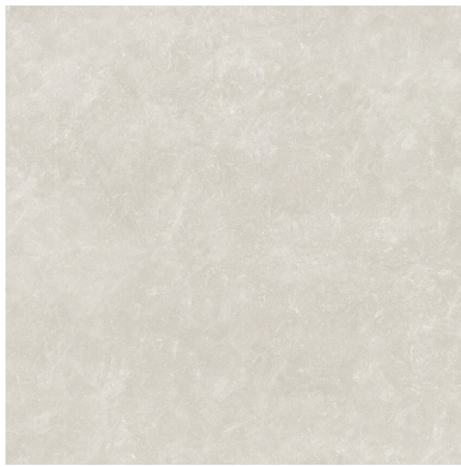
TOGA GREY P1212L