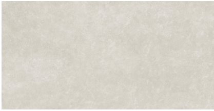
TOGA GREY XL2412L