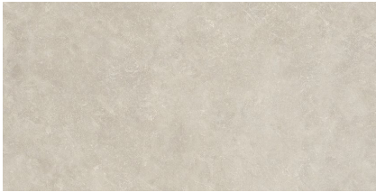
TOGA TAUPE P6012L