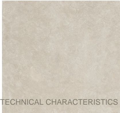
TOGA TAUPE XL2412L